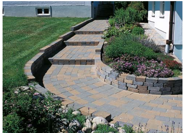
Trappa med Benders Labyrinth antik, helsten.