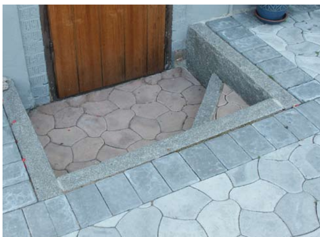
Trappa med granit och Bender Pompeji.