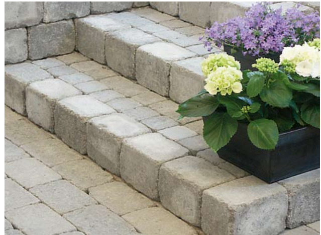
Trappa med Benders Labyrinth antik, kantsten och Knott.