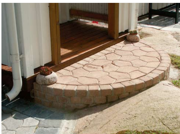
Trappa med Bender Labyrint antik Knott och Bender Pompeji.