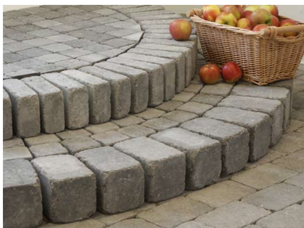
Trappa med Bender Labyrint antik, helsten, kantsten och Knott.