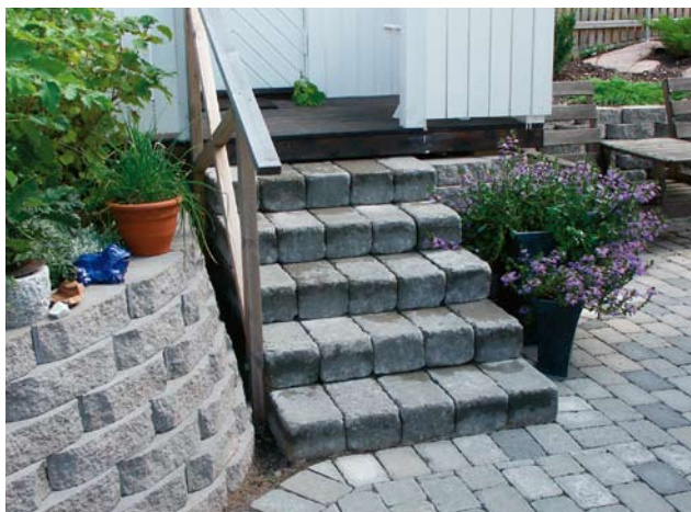
Trappa med Bender Labyrint antik, mursten.