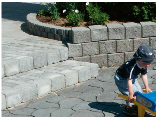
Trappa med Bender Labyrint antik, kantsten och Knott.