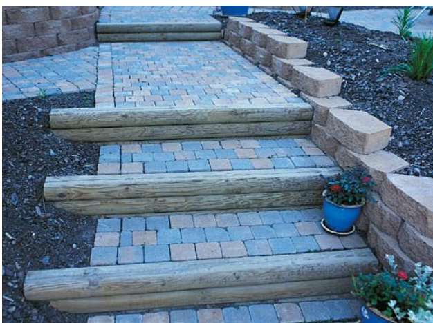
Trappa med Benders Labyrinth antik i kombination med trä.