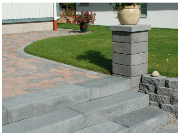
Trappa med Bender Blocksteg