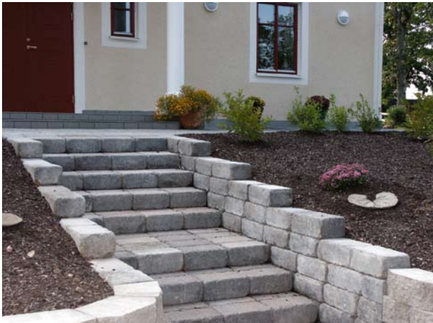
Trappa med Benders Labyrinth antik, mursten.