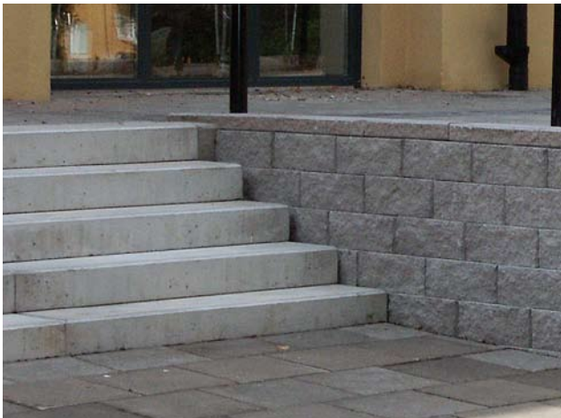
Trappa med Benders Blocksteg vid Benders Megastone mur.